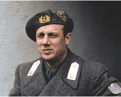
"Kara Prens" lakaplı Valerio Borghese

burjuva propagandaya rağmen, Alman ve İtalyan faşizminin eli kanlı kadroları ABD güçleri tarafından partizanların ya da savaş sonrası kurulan mahkemelerin elinden kurtarılıyor, savaş boyunca Sovyetler Birliği'ne ve partizanlara karşı edindikleri tecrübeden faydalanılmak üzere devşiriliyorlardı. Bu süreçte devşirilen en azılı faşistlerden biri "Kara Prens" lakaplı Vale-